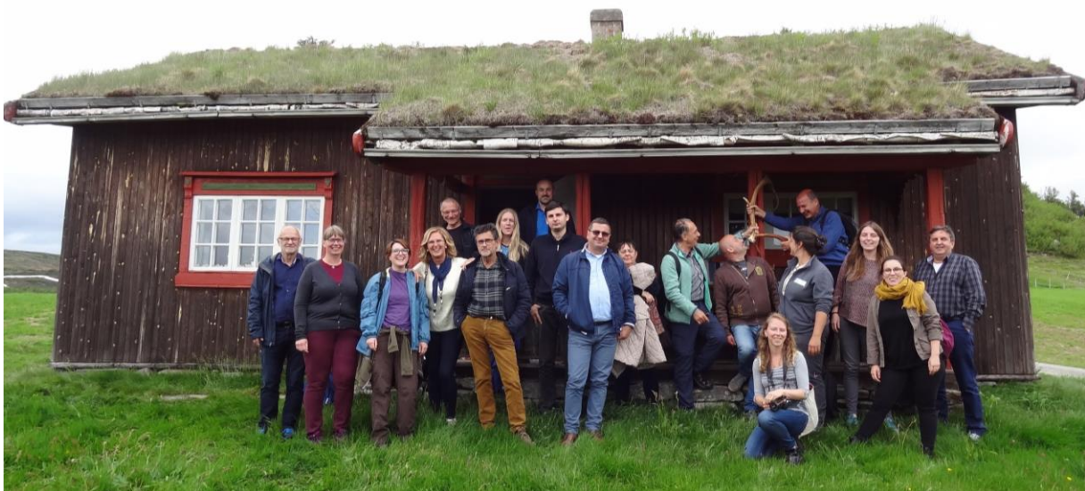
Styret i Euromontana på besøk på Spellmovollen i Os.