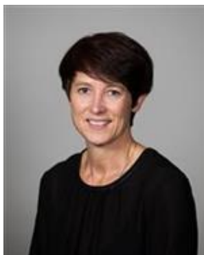
Aud Hove Nesteleder Oppland fylkeskommune