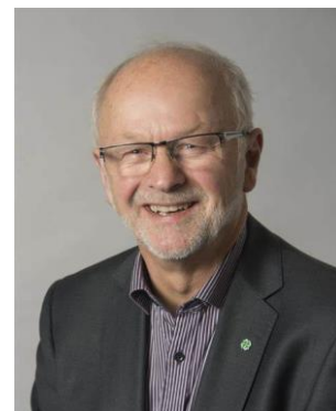
Arnfinn Nergård Hedmark fylkeskommune