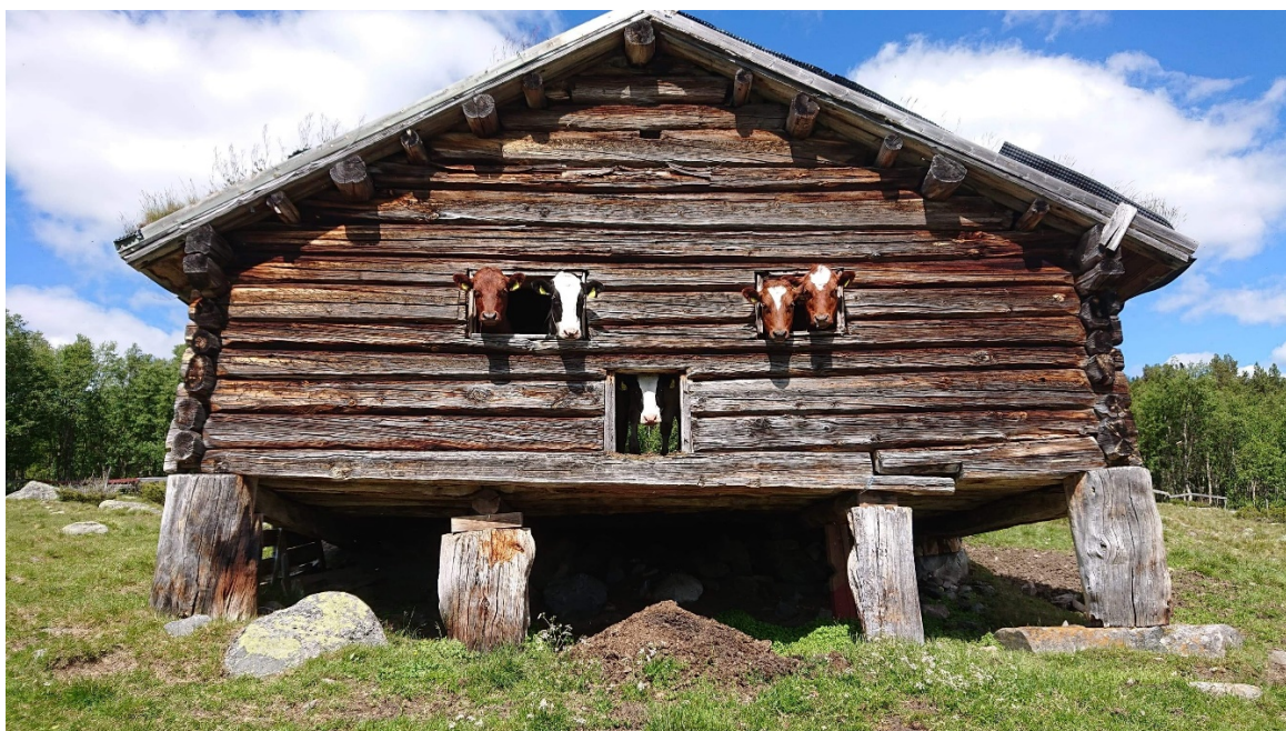
Seterdrift er ein viktig del av kulturarven. No arbeidast det for å få seterdrift inn på UNESCO si verdarvliste

Dagleg leiar i Fjellnettverket er med i fagleg ressursgruppe for arbeidet. Fjellnettverket støttar arbeidet med å få seterkulturen inn på UNESCO si verdsarvliste over immateriell kulturarv.