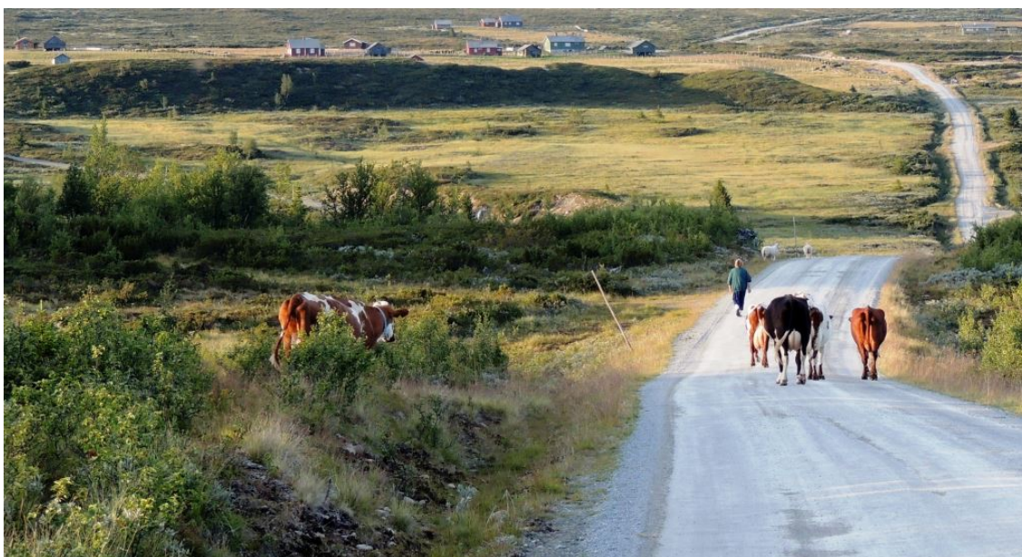
Kyr på veg heim til setra etter ein lang dag på beite

Korleis skal Noreg fram mot 2030 redusere utsleppa i ikkje-kvotepliktig sektor? Det var utgangspunktet for rapporten Klimakur 2030. Der vart det foreslått over 60 ulike tiltak frå utvalet som var sett av regjeringa til å arbeide med dette. Fjellnettverket sendte inn høyringssvar til rapporten. Der la me vekt på at nettverket støtta arbeidet med å redusere utsleppa i ikkje-kvotepliktig sektor. Men Fjellnettverket etterlyste ein samanheng mellom FNs berekraftsmål og påpeikte at skal me lukkast i å få eit meir berekraftig samfunn må klima og CO2-utslepp sjåast i samanheng med andre utfordringar samfunnet står overfor.