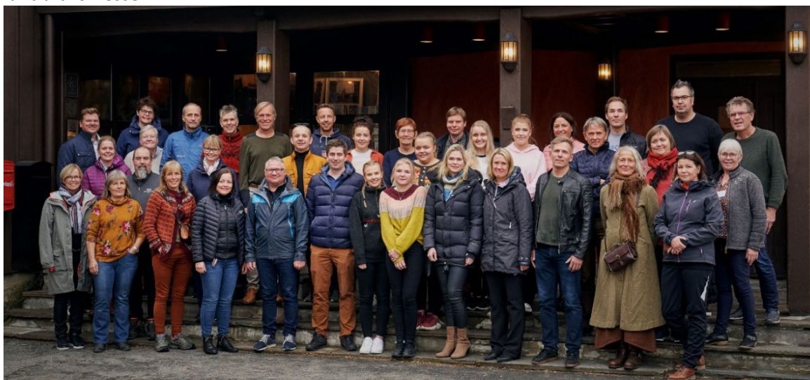
Stolte og spente mat- og opplevingsverksemder som skal til Berlin.

I 2020 fekk Fjell Noreg for tredje år på rad delta som ein av dei tre regionane som representerer Noreg på Internationale Grüne Woche (IGW) i Berlin. I Berlin representerte kokkar, lærlingar, matprodusentar og opplevingsverksemder fjellområda på ei av verdas største mat- og landbruksmesser.