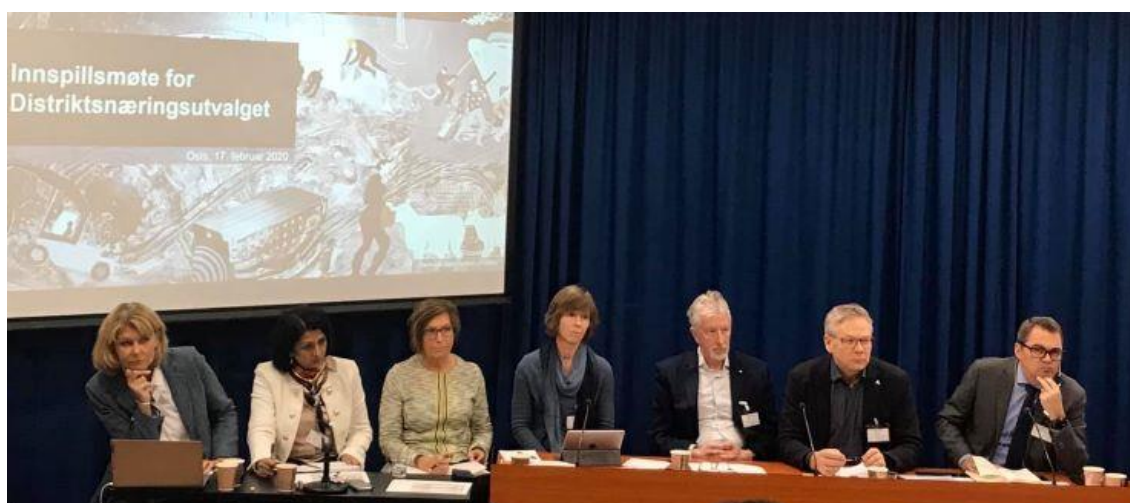
Distriktsnæringsutvalet tek i mot innspel frå Fjellnettverket.

Høyringssvar: Godt grunnlag for ny og offensiv distriktpolitikk