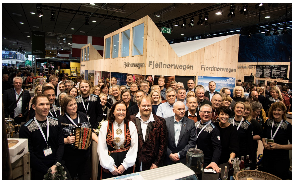
Regional delegasjon og deltakarverksemdar frå Fjell Noreg samla på standen i Berlin under Internationale Grüne Woche.

På grunn av korona vart Fjellkonferansen og planlagt ungdomskonferanse utsett til smittesituasjonen er avklart.