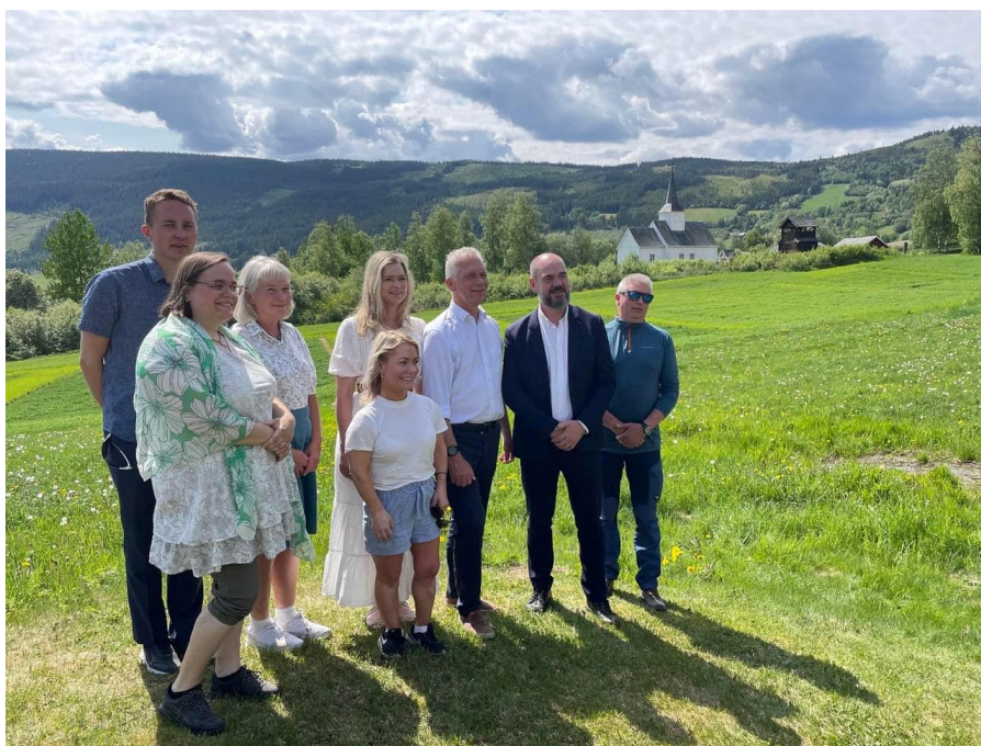
Styret i Nasjonalt senter for fjellandbruk og landbruks- og matminister Sandra Borch

I 2015 vart forskingsstasjonen og NIBIO si verksemd ved Løken gård i Øystre Slidre kommune nedlagt. Garden har vore ein statleg forskingsstasjon for fjellbygdene sidan 1922, og ein base for koordinering av forskning særleg på engvekster og grovfôrressursar, beitebruk og biologisk mangfald i stølsområda.