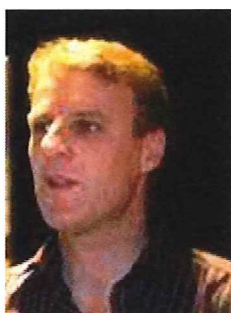
Tor Grøthe Buskerud fylkeskommune