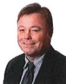
Dag Rønning Hedmark fylkeskommune